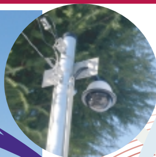
コントロール式Webカメラ

ASPサーバーから伝送された情報を監視し、テレメータデータをダウンロードして、データの分析が可能です。