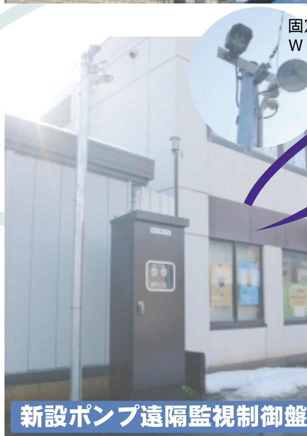
新設ポンプ遠隔監視制御盤